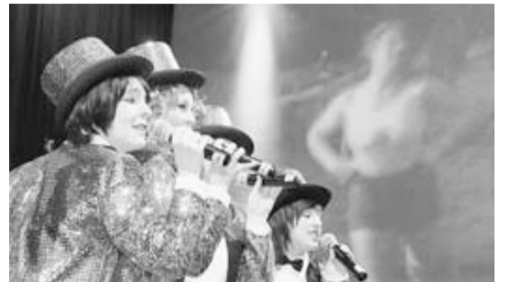
Musik und Bilder gibt es bei der Wupper-Gala.